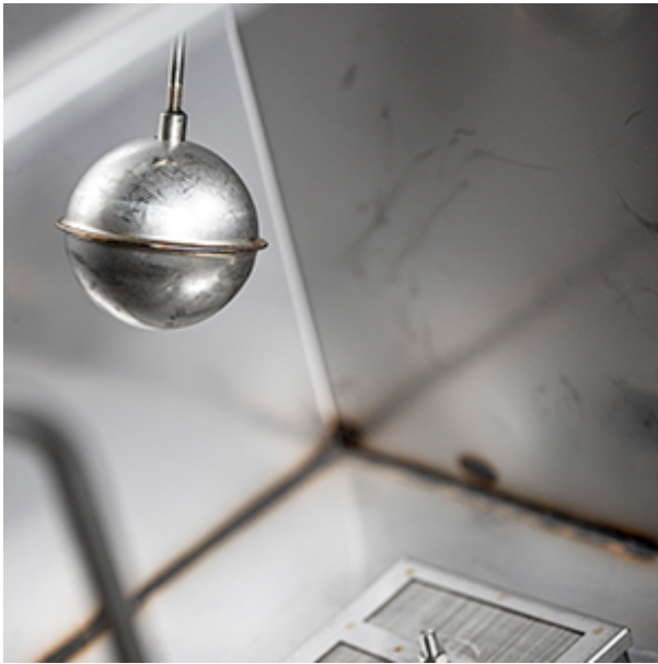
Galleggiante per allacciamento a rete idrica