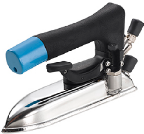
Ferro tutto vapore apicuciture