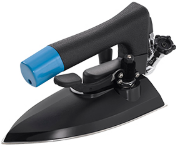
Ferro tutto vapore