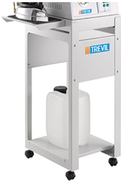
Tanica per il rabbocco inclusa