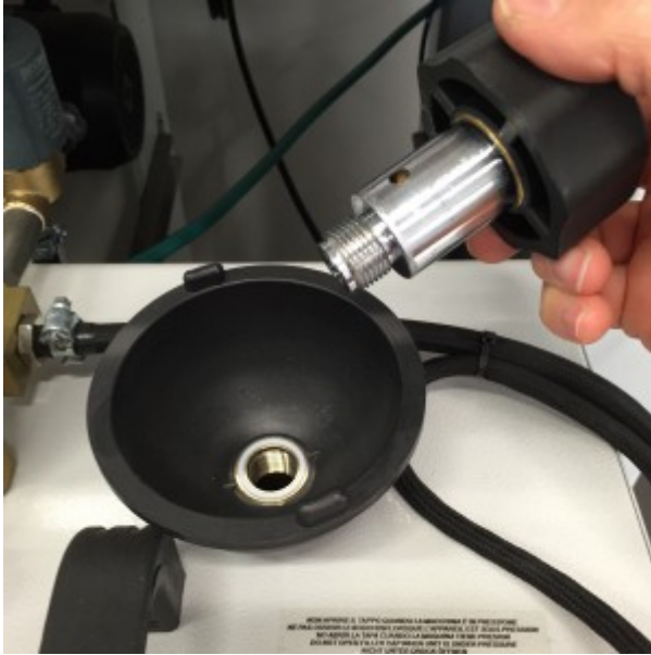
Imbuto di carico incorporato