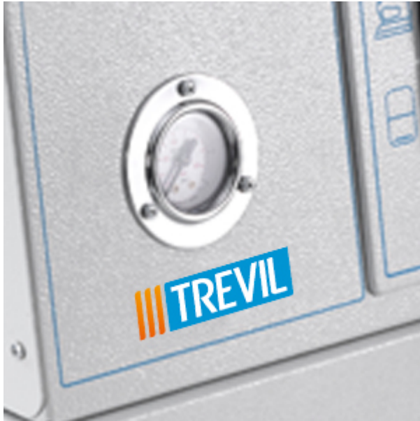
Manometro per la pressione del vapore