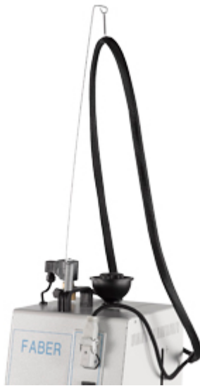
Supporto per il cavo del ferro