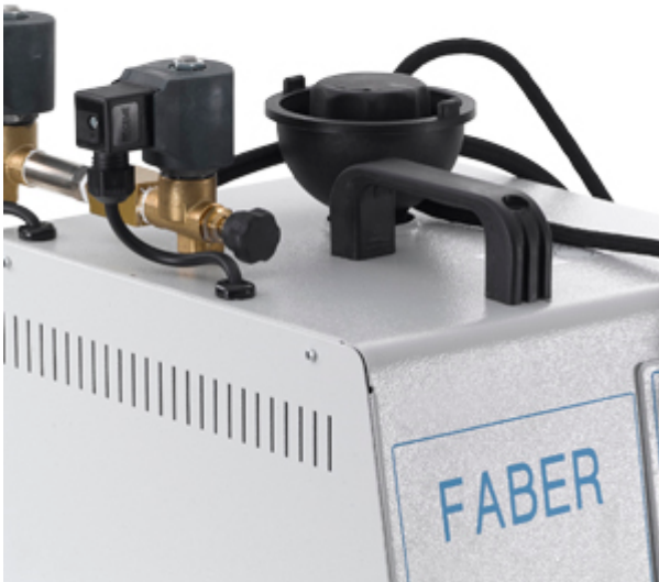
Maniglia per il trasporto